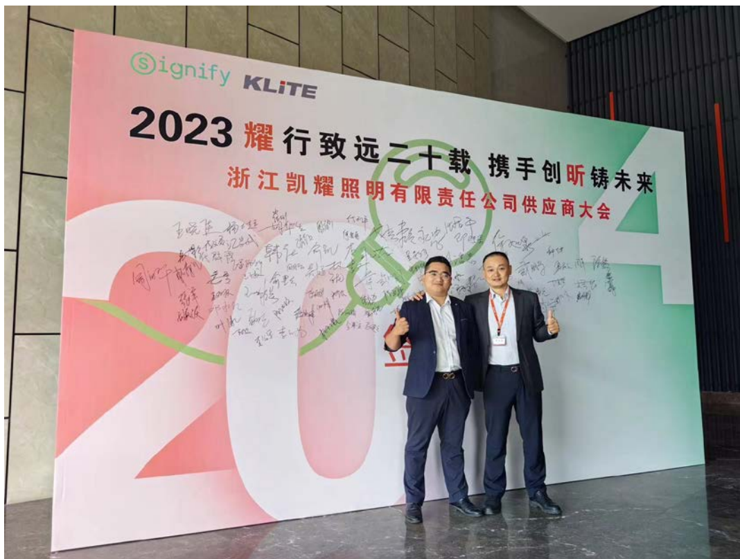
图 1 参加主要客户会议

公司本着诚实守信的原则, 与客户建立长期良好的战略合作关系, 按照公正公平、互惠互利的原则实现了共同发展: 在顾客需求的识别上, 公司尽最大可能了解顾客需求, 建立并实施了《客户满意度控制程序》、《客户档案管理控制程序》、《客户投诉控制程序》; 确立顾客满意度指标并领先同行, 增强了顾客对购买公司产品的信心。