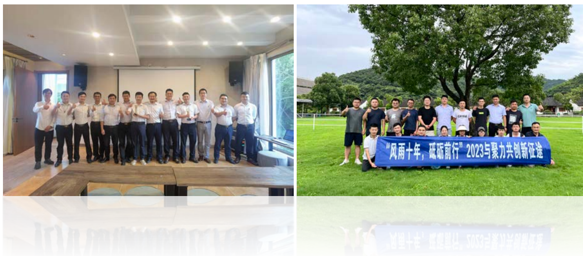
图2.1-2 公司多渠道企业文化传播

公司总经理非常注重企业文化建设，他相信“文化是最顶层，包括团队的方向，追求持续经营，要做顶尖企业就必须打造好企业文化”。